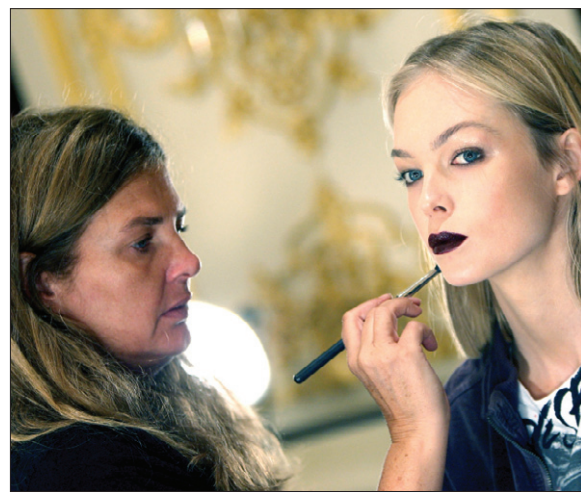
من عرض جايسون وو خلال أسبوع نيويورك الأخير، الذي ارتدى فيه المصمم أن يأخذ المظهر القوطي من الخريف والشتاء، إلى الربيع والصفيق المقلبين

أن القصد من هذا الماكياج ليس وضع لون شفاف وغير مرئي على الوجه وتوجيهه فحسب، وإنما يقصد به وضع لون يضاهي لون البشرة ويتمزج معها بسهولة، إضافة إلى إبراز الجفون باستخدام درجات اللون البيج الخفيفة، وترك الشفاه تتنالا بدرجات اللون الوردية أو المشمشي أو الذهبي، مثلا. وتمشيا مع درجات الألوان الطبيعية يحرص فنانو الماكياج الأمريكيين بشركة «إيست لور» على إضافة مسحة من اللون الذهبي لإضفاء بريق ولعنان يوحي بعدم التكلف وتشير بربطنا إلى أن الماكياج الطبيعي يصلح لموسم الشتاء القادم، لأنه من جهة يتوفر على الوان طبيعية دافئة بدرجات متنوعة، بعضها هادئ وخفيف وبعضها الآخر يعيق بالوان القهوة والشوكولاته، والأهم من هذا أنه يتماشى مع موضحة الأزياء السائدة حاليا، التي تغلب عليها قماش الصوف مغزولاً بغزرات كبيرة، ولا تناسبه الألوان الصارخة مثل الأحمر القاني كثيرا.