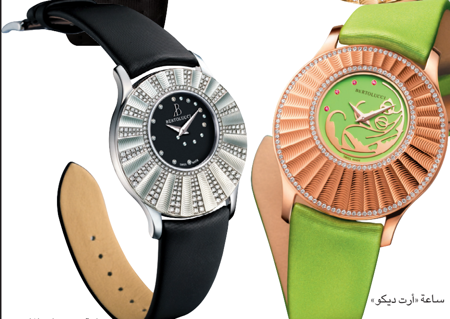
ساعة «أرت ديكو»