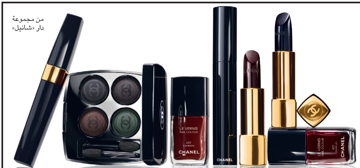
من مجموعة دار «شانيل»