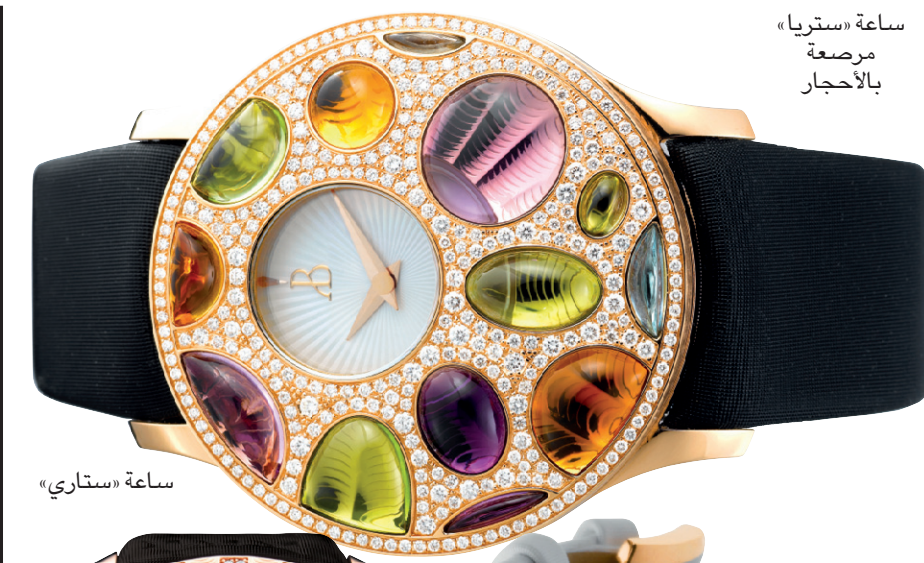
ساعة «ستريا» مرصعة بالأحجار

حسن حفظنا أنهم في هذا الموسم قرروا أن تكون كل الألوان مقبولة، بما فيها الوردية على الجفون عوض الخضود والشفاه، مبررين أن الطريقة التي توضع بها هذه الألوان هي ما يفرق إطلالة أنيقة عن إطلالة عادية أو مبهرجة. في هذه الصدد، يدلي مارتن رومان من رابطة موزعي مستحضرات التجميل بالعاصمة الألمانية برلين، بدلوه قائلا إن الماكياج الطبيعي الذي يعتمد على درجات الألوان الطبيعية والترابية يشكل اتجاهها واحدا فقط، لأن هناك إقبالا لا بأس به على الماكياج الداكن الذي يعتمد على الدرجات الغامقة، التي قد تمثل للبعض منا جرة لا يقدر عليها سوى من يميلون إلى موضحة «البانكس» أو المظهر «القوطي» بعيونه الكحيلة وشفاهه المائلة إلى الغامق. ما يزيد من تقبله أن دار «شانيل» طرحت مجموعة غامقة تلعب على سحر المظهر القوطي وتلقي رواجا كبيرا بعيدا إلى الأذهان النجاح الذي حققه